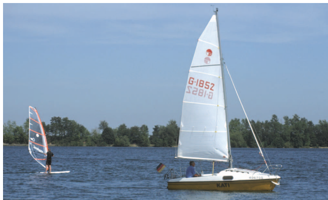
Segelsport auf den Villeseen