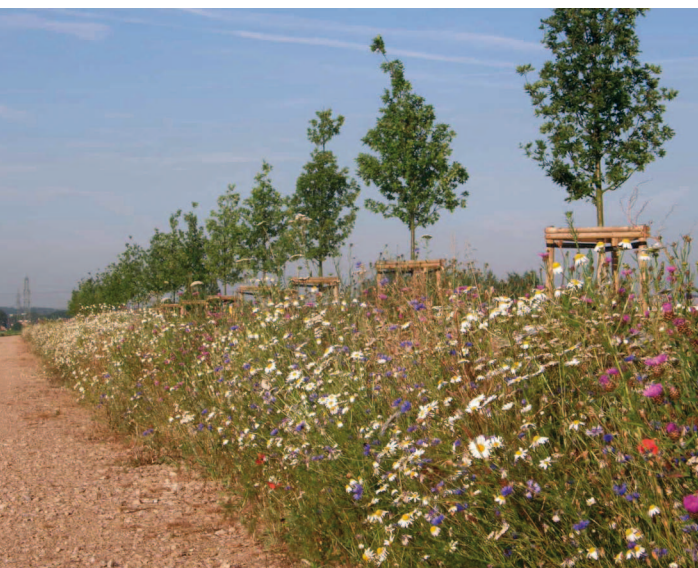
In der Stotzheimer Agrarlandschaft: junge Eichenallee mit Wiesenkräuterstreifen

Als Folge dieser Intensivlandwirtschaft verschwanden jedoch nahezu alle natürlichen Landschaftselemente. Das RegioGrün-Projekt wirkt dem entgegen: Die Radroute wurde mit Baumallee und Blühstreifen versehen, die ein naturnahes Band in der Landschaft bilden, an dem sich Insekten, Kleintiere und Vögel wieder ansiedeln können. Dem Gleueler Bach wurde durch Gehölzanpflanzungen Naturnähe zurückgegeben und dem Gewerbegebiet von Marsdorf ein breiter Waldstreifen vorgelagert. Die Ortsränder von Efferen und Hermülheim sind durch breite Grünflächen mit Wiesen und Gehölzgruppen gegen die Ackerlandschaft abgegrenzt worden.