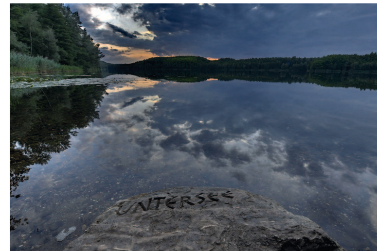
Abendstimmung am Untersee auf der Ville