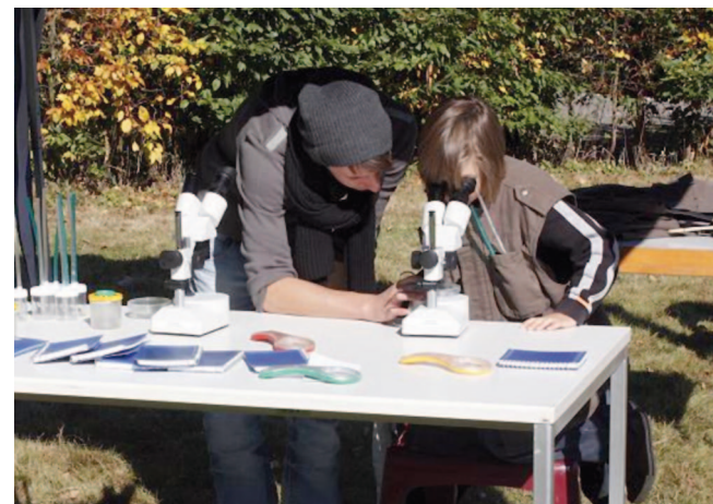
Im Umweltzentrum Friesheimer Busch untersucht ein „Juniorforscher“ unter Anleitung die Natur mit dem Binokular

Zudem entstand hier im Rahmen des RegioGrün-Projektes ein Bodenerlebnispark für Groß und Klein, der als Umweltbildungszentrum rund um das Thema Boden angelegt wurde.