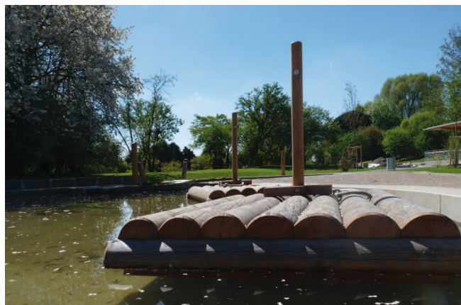
Spannende Wasserlandschaft an der Gymnicher Mühle