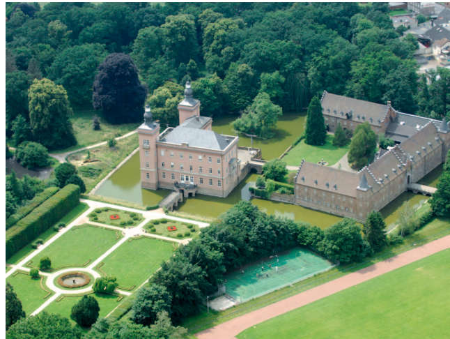
Schloss Gracht mit umgebenden Parkanlagen

18 Schloss Gracht: Das Schloss mit Parkanlage ist eines der eindrucksvollsten Wasserschlösser des Kölner Raums mit kulturhistorisch wertvollem englischen Landschaftsgarten aus dem 17. Jh. und einem ökologisch hochwertigen naturnahen Altwaldbestand.