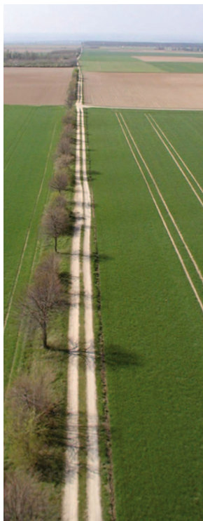
Gradliniger Verlauf der Römerstraße in Erfstadt

● Römische Agrippa straße: Die ehemalige römische Staatsstraße, die von Köln über Trier und Lyon bis Marseille führte, ist über weite Strecken im Gelände noch erhalten und erfahrbar. Sie kreuzen dieses Stück lebendige Geschichte zwischen Ahrem und Friesheim an der L163.