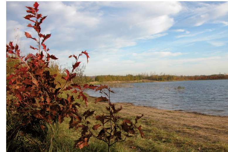
Am Boisdorfer See auf dem Marienfeld