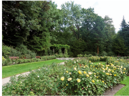
Parkanlage im Äußeren Kölner Grüngürtel

Die Erlebnisradroute West verläuft entlang der nach Westen führenden Eisen- und Autobahn und verbindet den Rhein über die Grünflächen der Stadt Köln mit den landschaftlichen Sehenswürdigkeiten von Ville und Erft.