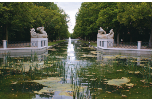
Rundbecken in der Rautenstrauchstraße mit den Skulpturen „Kentaur und Najade“

Im Jahr 2011 wurden die Lindenthaler Kanäle im Rahmen des RegioGrün-Projektes revitalisiert. Um Nährstoffeinträge zu vermindern, wurden – neben einer Entschlammung der beiden Kanalabschnitte und der Instandsetzung der Ufer – Reinigungszonen mit Irisbeständen eingerichtet. Sie filtern Schwebeteilchen aus dem Wasser. Am Ende des Clarenbachkanals sorgt ein sogenannter „Siebbandrechen“ für die Abfuhr von Laub und anderen größeren Einträgen. Im Rondell am Karl-Schwering-Platz belüftet eine kleine Schaumspudelfontäne das Zentrum des Rundbeckens.