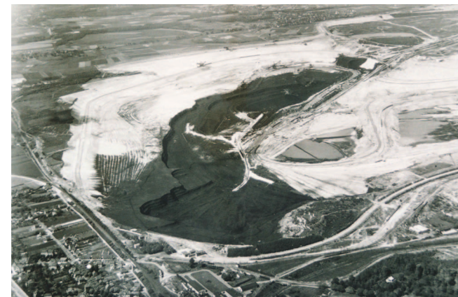
Historische Aufnahme des Tagebaus Frechen

Nach 1986 wurde der Tagebau bis 2003 mit Kies und Abraum aus den Tagebauen Garzweiler und Hambach verfüllt. Das Gelände wird heute landwirtschaftlich, als Industriegebiet und zur Naherholung genutzt. An der tiefsten Stelle des ehemaligen Tagebaus befindet sich der nach der abgebagerten Ortschaft Boisdorf benannte See. Er ist ca. 17 ha groß und nicht zum Baden geeignet. Die Senke wird vom Erftverband als Hochwasserrückhaltebecken für die Erft genutzt; die entsprechenden Wehre können Sie vor Ort besichtigen.