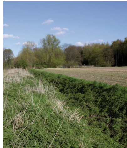
Das Bachbett des Frechener Baches liegt häufig trocken.

Rhein – wie die meisten der Vorgebirgsbäche – im sandigen Untergrund der Rheinterrassen, im heutigen Stadtwald, ohne den Rhein oberirdisch zu erreichen. Heute speist die Kläranlage Frechen den Frechener Bach, sein Bachbett ist überwiegend betoniert und er mündet in den Kölner Randkanal. Der Frechener Bach soll im Rahmen von RegioGrün im Bereich des Äußeren Kölner Grüngürtels renaturiert und in sein historisches Bachbett zurückverlegt werden.