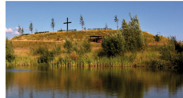
„Papsthügel“ oberhalb eines angelegten Weihers auf dem Marienfeld

11 Tagebaublick: Von hier aus haben Sie einen weiten Blick über den ehemaligen Tagebau Frechen mit den rekultivierten Flächen (s. Detailbeschreibung).