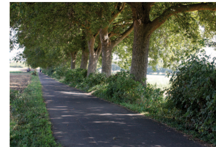
Geschützte Walnussbaumreihe bei Gut Clarenhof

9 Walnussbaumallee: eine historische und geschützte Reihe aus 89 Walnussbäumen bei Gut Clarenhof, die ca. 70-80 Jahre alt sind.